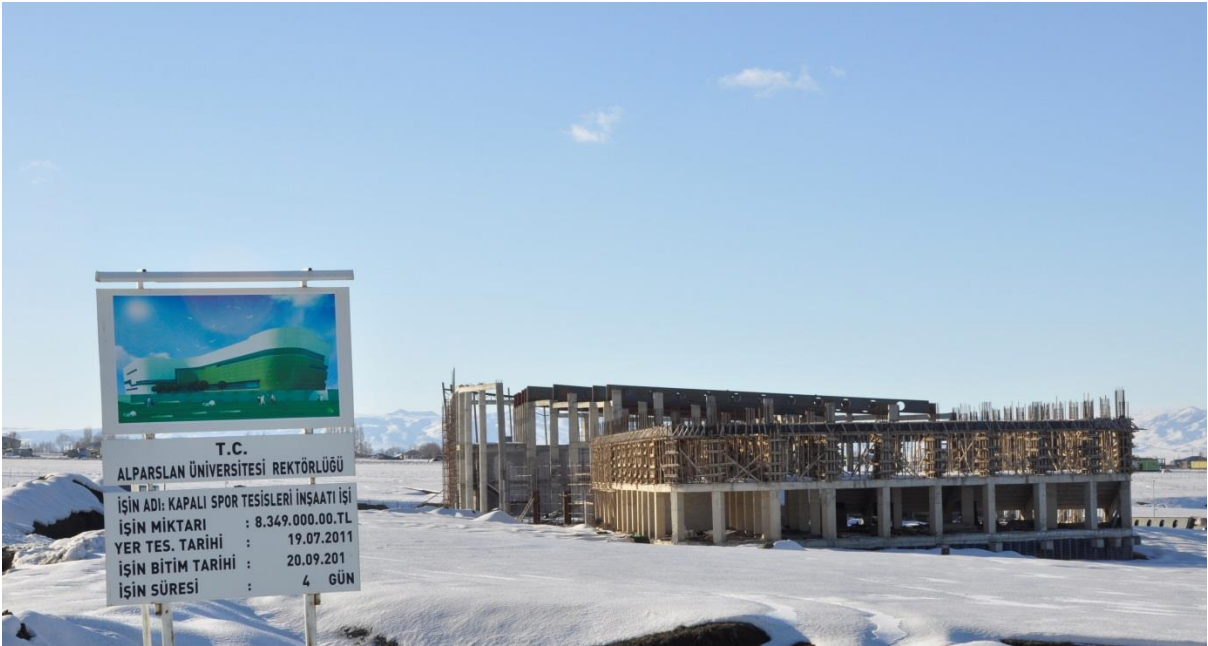
Resim 5. Kapalı Spor Tesisleri

“Açık ve Kapalı Spor Tesisleri” projesine bağlı olarak 2010 yılında ihalesi yapılan 9.000 m 2 kapalı alana sahip “Kapalı Spor Tesisleri”nin inşaat çalışmalarına 2011 yılında başlanmış ve 2012 yılı sonu itibariyle % 53’ü tamamlan projenin inşaat çalışmaları devam etmektedir.