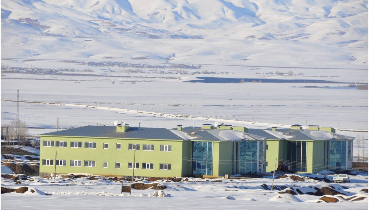
Resim 6. Merkezi Arařtırma Laboratuarı

“Merkezi Arařtırma Laboratuarı” binasının yapım iři 2010 yılında ihale edilmiř ve ihale sonulandırılmıřtır. 2010 yılında yapımına bařlanılan, 2.000 m 2 si “Merkezi Arařtırma Laboratuarı” projesinden, geri kalan 4.000 m 2 lik kısmı ise “Derslik ve Merkezi Birimler” projesine baėlı olarak toplam 6.000 m 2 kapalı alana sahip “Merkezi Arařtırma Laboratuarı” yapım iřinin, 2012 yılı sonu itibari ile % 90’ı tamamlanmıř ve inřaat alıřmaları devam etmektedir.