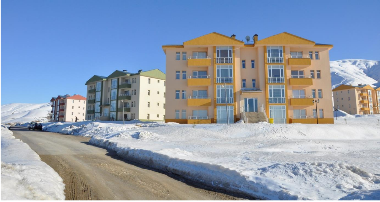
Resim 4. Lojmanlar