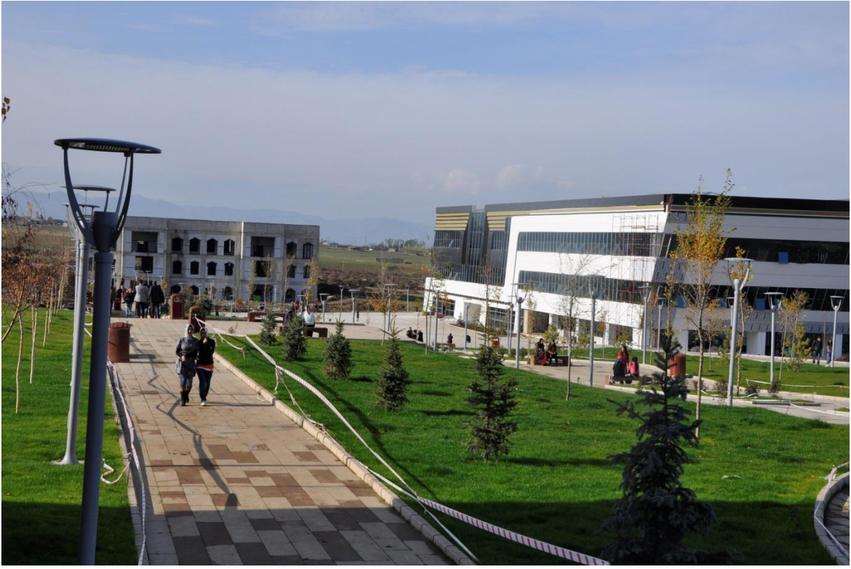
Resim 3. Kütüphane ve Bilgi İşlem Merkezi ile Merkezi Kafeterya