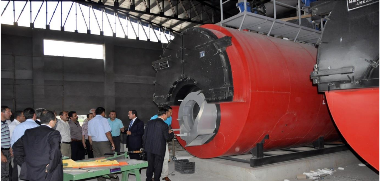
Resim 2. Kampüs Isı Merkezi